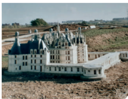
1991... En construction Château de Chambord